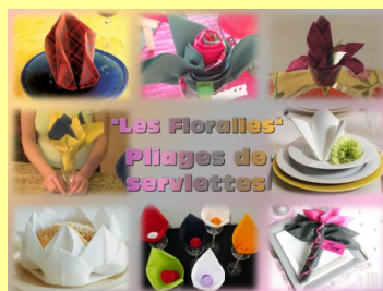
Des réalisations printanières

AFLEC 02 43 69 56 74 au plus tard le 6 mai